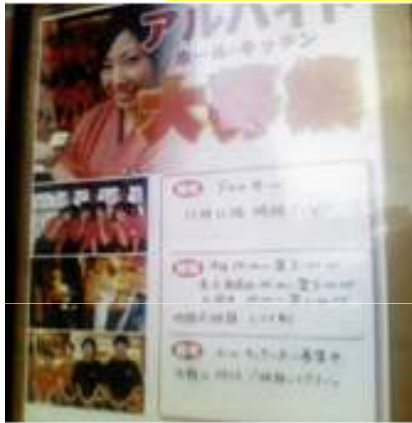
居酒屋さんで2分バイト