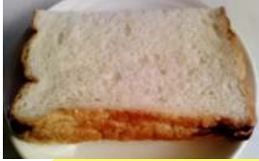
4つ切り食パン2分の1枚