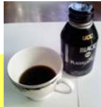
缶コーヒー4分の1本